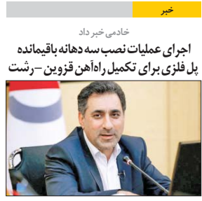
خادمی خیر داد اجرای عملیات نصب سه دهانه باقیمانده پل فلزی برای تکمیل راه آهن قزوین - رشت